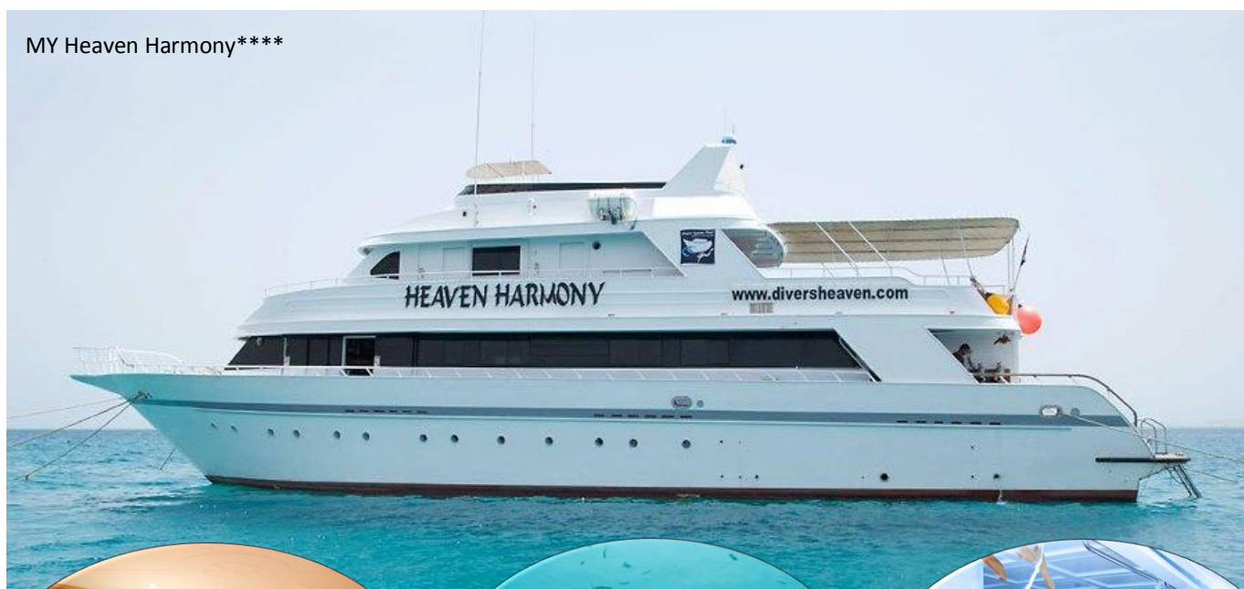
MY Heaven Harmony****